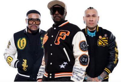
BLACK EYED PEAS