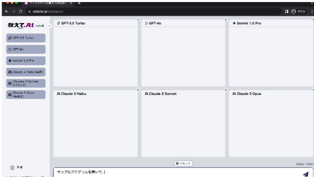
▲ 『教えて AI 一発検索』 プロンプトを 6 つの AI モデルで同時に実行

さらに、複数の AI モデルを並行して実行できることで、プロンプトの精査や大規模な分析作業の効率化が期待できます。「教えて AI byGMO」は、生成 AI の利便性を最大限に高め、あらゆるシーンで AI を活用しやすい環境を提供し続けます。