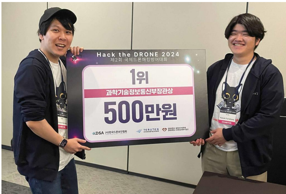
授賞式での参加メンバー記念写真