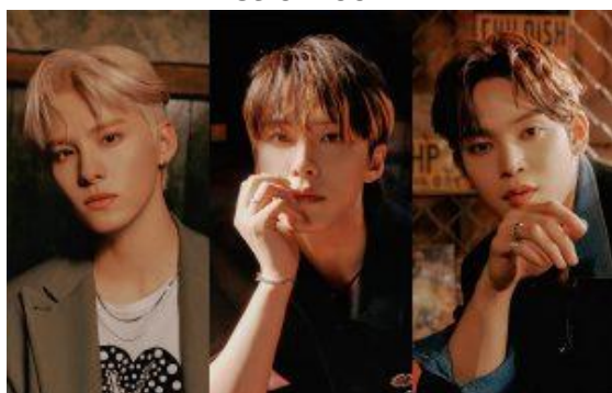
川西拓実・河野純喜・與那城奨 from JO1