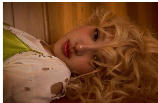
ロゼ ROSÉ [NEW]