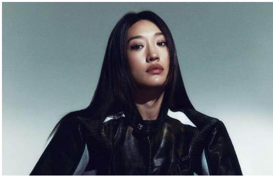
ペギー・グー Peggy Gou