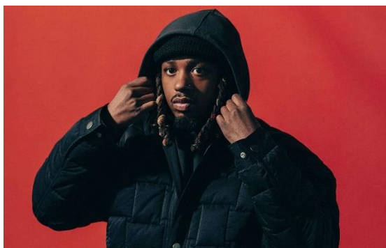
メトロ ブーミン Metro Boomin