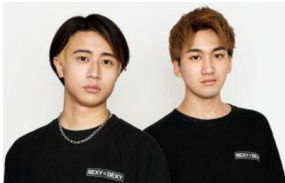
レクシー デクシー REXY=DEXY