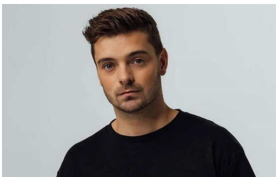
マーティン・ギャリックス Martin Garrix