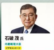
石破茂氏 内閣総理大臣 ビデオメッセージ