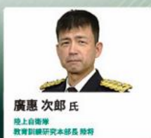
廣恵次郎氏 陸上自衛隊 教育訓練研究本部長 陸将