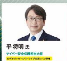
平将明氏 サイバー安全保障担当大臣 ビデオメッセージのライブ配信のご登壇