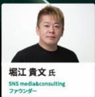
堀江貴文氏 SNS media&consulting ファウンダー